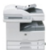
HP LaserJet M5035 MFP